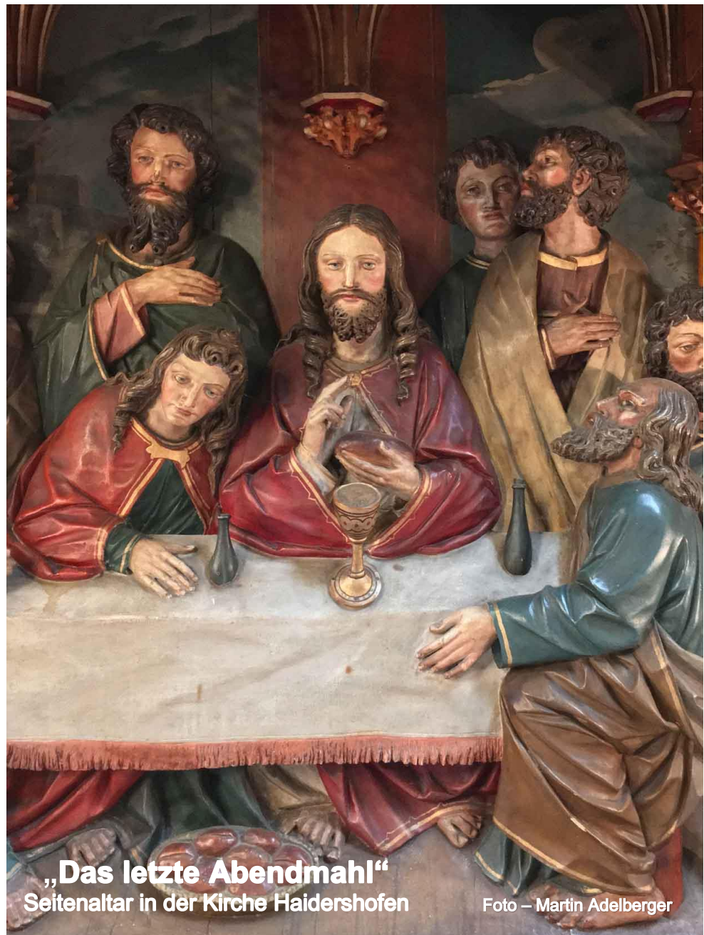
„Das letzte Abendmahl“ Seitenaltar in der Kirche Haidershofen

Telefonische Terminvereinbarung ist bei Bedarf möglich